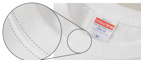
首リブのダブルステッチ ※5001-03、5001-02/90cmサイズはステッチなし

「伸びにくい首回り」はTシャツを長く愛用するための必須条件。ユナイテッドアスレズ#5001は首リブに「ダブルステッチ」を採用しているので、着ては洗濯を繰り返しても、首元がヨレヨレになるなんてことはありません。