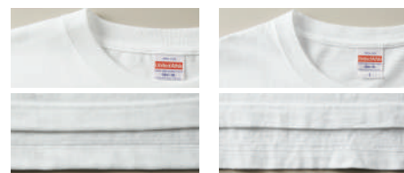
未着用の5001-01(左)と、1年間着用した5001-01(右)

5.0~7.0オンスが一般的に「ヘヴィーウェイト」とよばれる生地厚で、「5.6オンス」は一枚で着用できるちょうど良い生地感と強度を兼ね備えています。丈夫で長く着用できるので、洗濯を繰り返してもへこたれません！