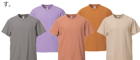
2020SSから新たに登場した期間限定色の「リミテッドカラー(全5色)」

「みんなでおそろいのTシャツを作りたい」「店舗スタッフのユニフォームに」といった需要には、カラバリの豊富さで答えます。コーポレート・スクールカラーにも答えられる56カラーのラインアップにはきっとお探しのカラーがあるはずですよ。